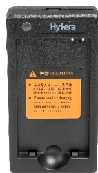
Carregador Rápido-Rate (para Li-Ion) CH10L20