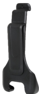
Clipe de cinto PD356

Acessórios versáteis para tarefas específicas