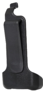
Clipe de cinto PD366