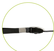
Correia de nylon