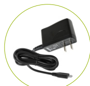
Adaptador de alimentação micro USB (5V/1A)