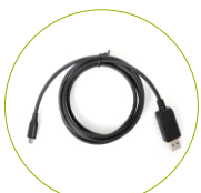
Cabo de programação PC69